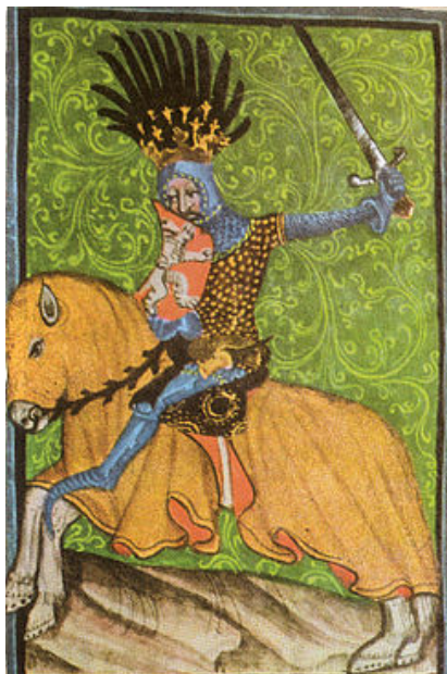
Juan de Bohemia

Pero no fue el único guerrero discapacitado de la Edad Media.