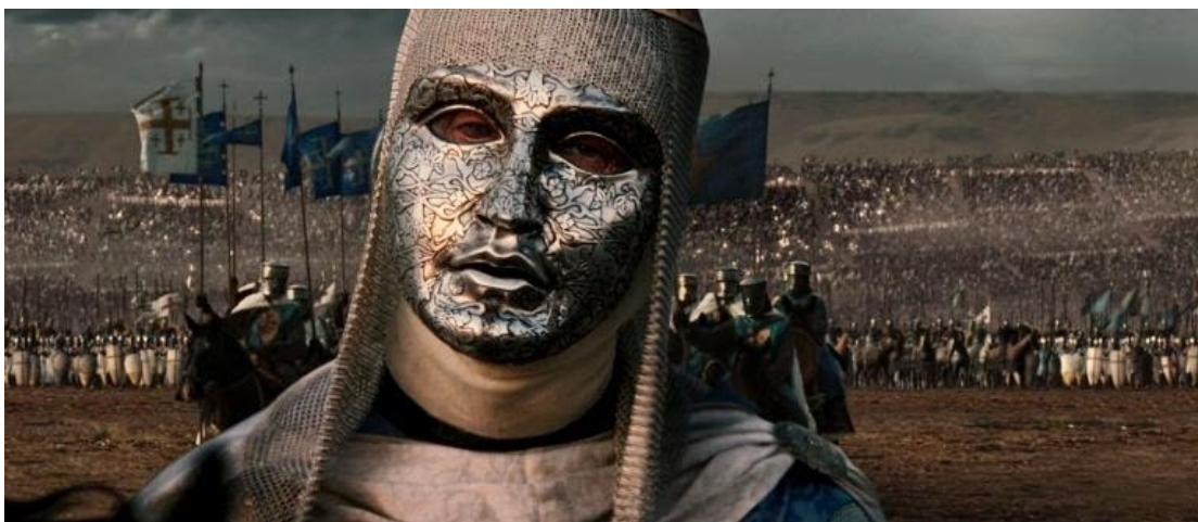
Balduino IV, rey de Jerusalén

El rey Juan de Bohemia murió cabalgando en plena batalla de Crecy contra los ingleses, y llevaba ciego diez años.