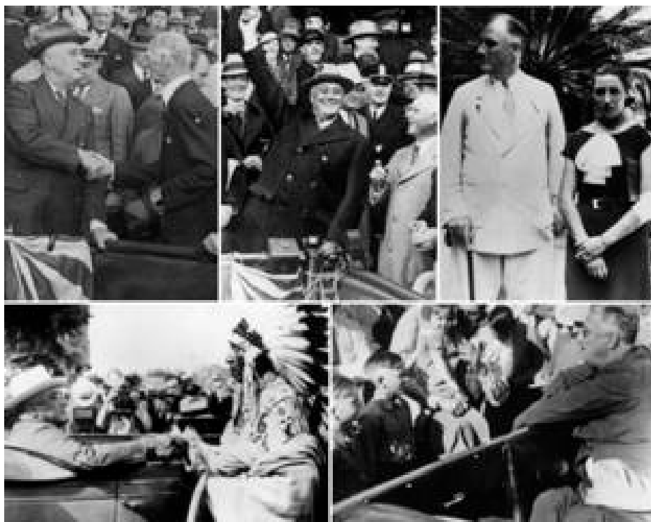
Franklin Delano Roosevelt fue presidente de Estados Unidos entre 1933 y 1945.

Paralizado de la cintura para abajo por más de una década antes de convertirse en mandatario, Roosevelt también se empeñó en ocultar su discapacidad.