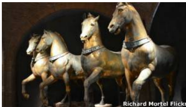
Los Caballos de San Marcos de Venecia provienen de la capital bizantina.