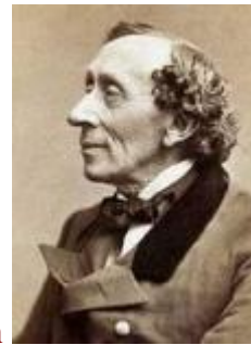
Hans Christian Andersen

El traje nuevo del emperador - Hans Christian Andersen .46