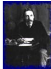
Robert Louis Stevenson

Margarita o el poder de Farmacopea - Adolfo Bioy Casares .82