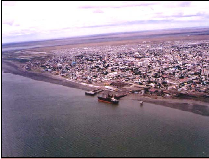
Río Gallegos. Santa Cruz. República Argentina