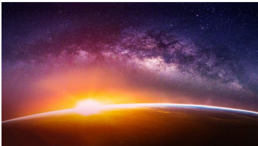
El Fondo Cósmico de Microondas es un enigma para los científicos

La inflación ofrece una manera de resolver este llamado " problema de homogeneidad ".