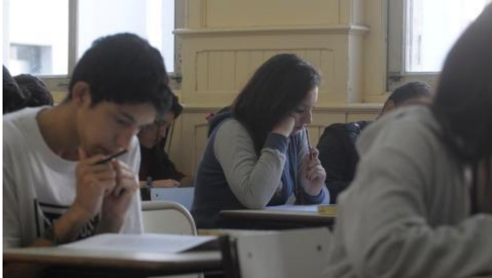
Alumnos de la Escuela Normal N°3 durante una prueba PISA.

Comenzarán a aplicarse el año que viene.