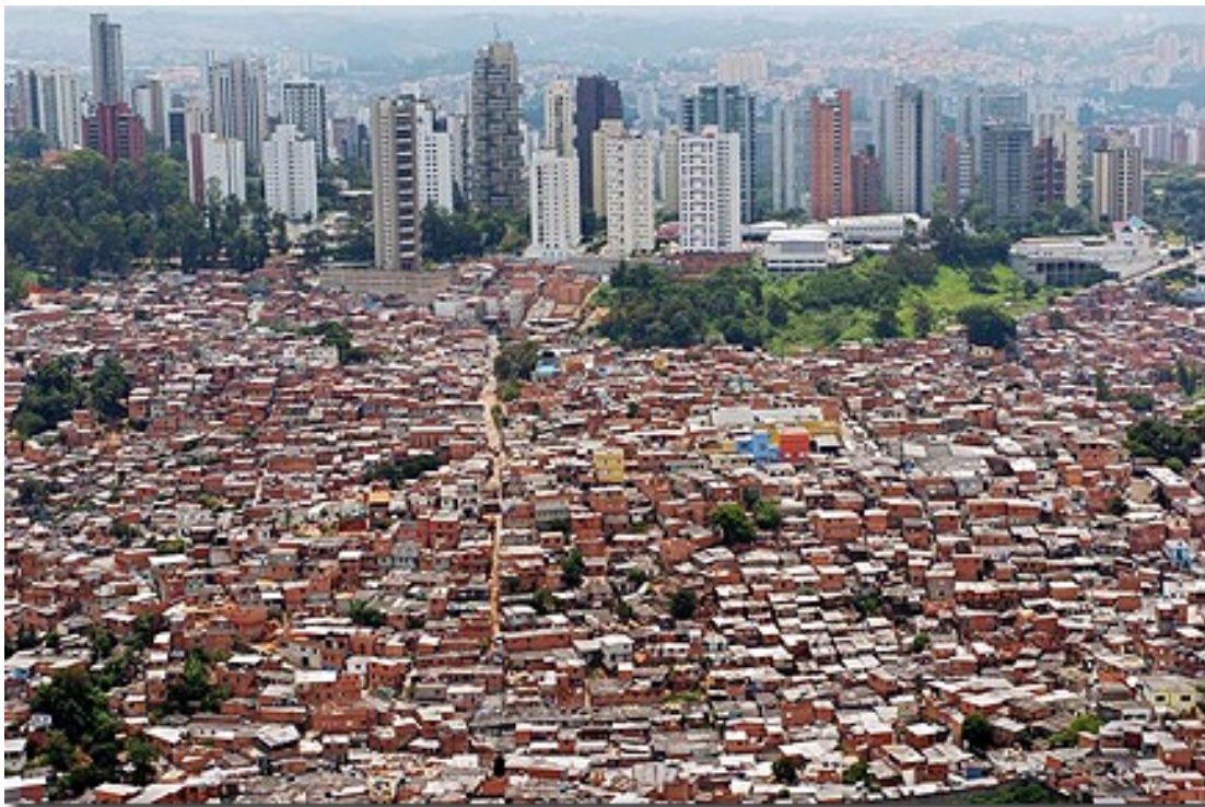
Favela en Río de Janeiro

Esta enorme brecha entre privilegiados y el resto de la humanidad, lejos de suturarse, ha seguido ampliándose desde el inicio de la Gran Recesión , en 2008. La estadística de Credit Suisse , una de las más fiables, solo deja una lectura posible: los ricos saldrán de la crisis siendo más ricos, tanto en términos absolutos como relativos, y los pobres, relativamente más pobres.