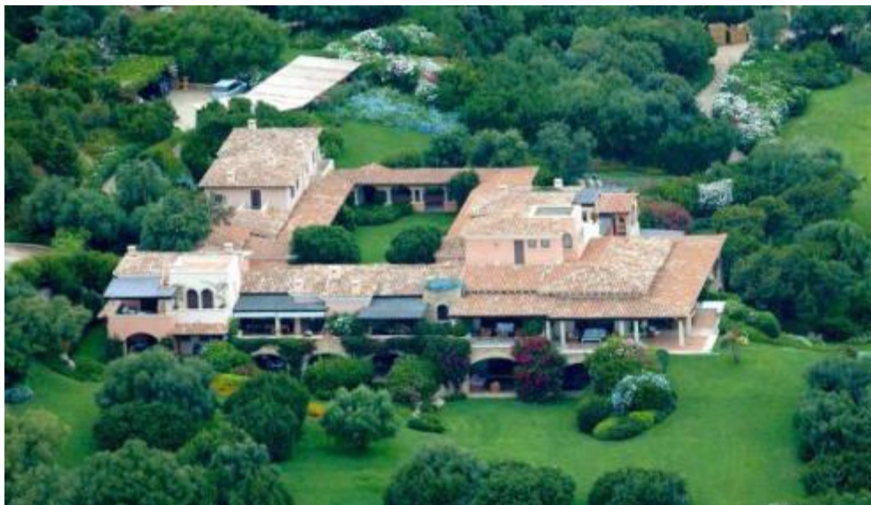
Vista aérea de villa Certosa, la mansión de Silvio Berlusconi en Cerdeña.