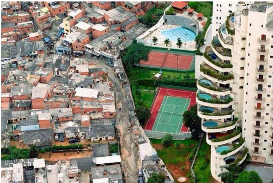
India. Pobreza y riqueza

Otro dato apoya la tesis del aumento de la inequidad: aunque el número de muy ricos (aquellos que tienen un patrimonio igual o superior a los 50 millones de dólares) se ha reducido en cerca de 800 personas desde mediados de 2014 por la fortaleza de la moneda estadounidense frente al resto de grandes divisas, el número de ultrarricos (aquellos que tienen 500 millones o más) ha repuntado “ligeramente”, según Credit Suisse, hasta casi 124.000 personas. Ni siquiera el ajuste por tipo de cambio es capaz de contrarrestar su aumento. Por países, casi la mitad de los muy acaudalados reside en EE UU (59.000 personas), 10.000 de ellos viven en China y 5.400 tienen residencia en Reino Unido.