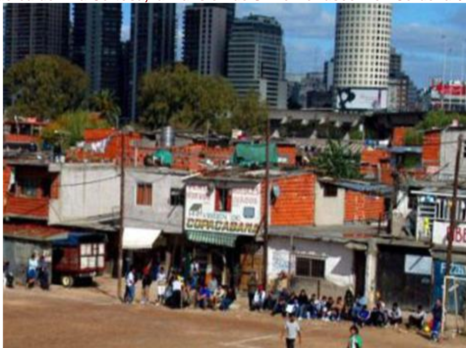
Villa 31 Buenos Aires a pocas cuadras de lujosos edificios