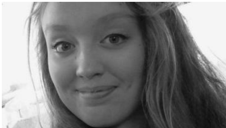
Dix se suicidó a los 14 años. Su caso desató un debate sobre el suicidio en Reino Unido.

Un problema "que ha estado envuelto en tabú durante demasiado tiempo", según la Organización Mundial de la Salud (OMS).