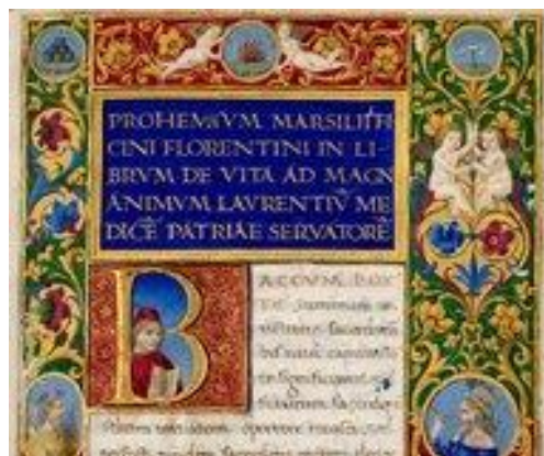
Tres libros sobre la vida