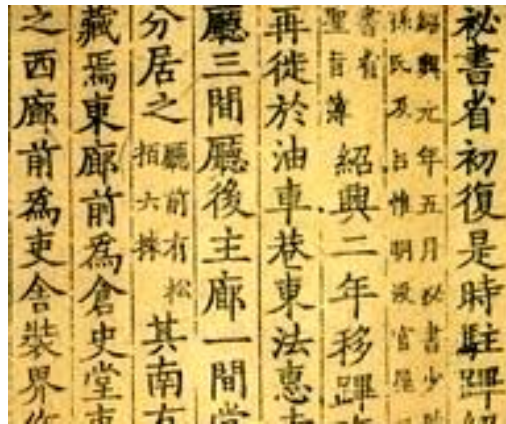
Registros de la biblioteca imperial de Song del Sur