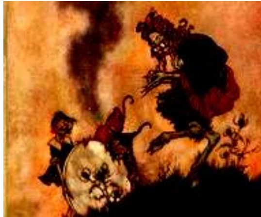
Cuentos de Hans Andersen