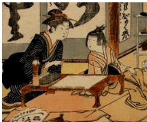
La Muchacha Gyokkashi Eimo